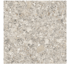
60081 | Aria Glacier 36" x 36", Décalé 18", NPI