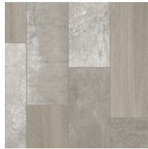
60021 | Markham Blé 36" x 36", Décalé 18", NPI