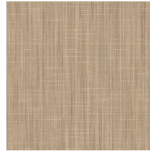
60071 | Strata Cachemire 36" x 36" NPI