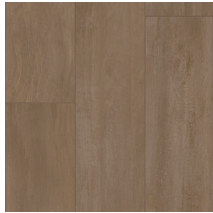
60052 | Sedwick Kobicha 36" x 72" NPI