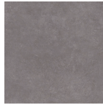
60031 | Ozart Greige 36" x 36", Décalé 18", INV