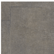
60092 | Baxton Terre 36" x 72" NPI

Le couvre-sol High Street MC est construit pour durer ce qui en fait une solution de revêtement de sol idéale pour le client Commercial léger.