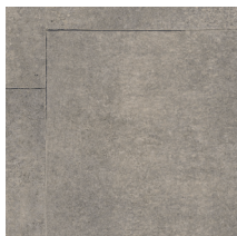
60091 | Baxton Calcaire 36" x 72" NPI