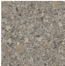
60083 | Aria Fer 36" x 36", Décalé 18", NPI