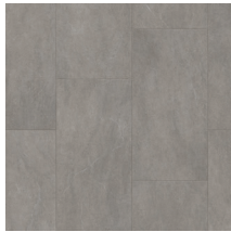
60001 | Oslo Étain 48" x 72" NPI