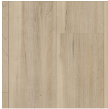
60061 | Monroe Sunkiss 48" x 72", Décalé 24", NPI