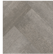
60041 | Rowell Bisque 36" x 72" NPI