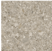
60082 | Aria Lunaire 36" x 36", Décalé 18", NPI