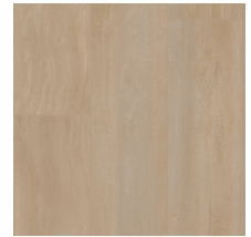
60051 | Sedwick Chai 36" x 72" NPI