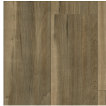
60062 | Monroe Châtaigne 48" x 72", Décalé 24", NPI