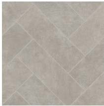
60011 | Corbin Latté 36" x 72" NPI