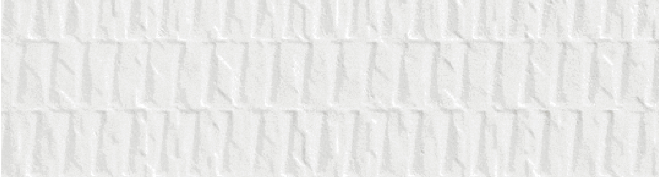
origami - mat texturé