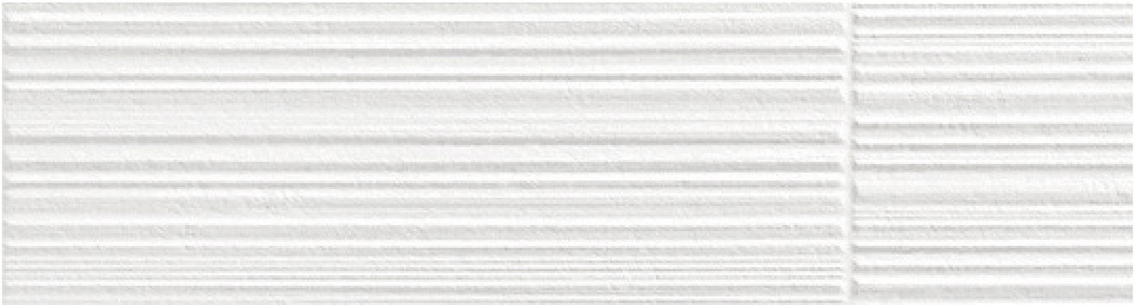
barcode - mat texturé