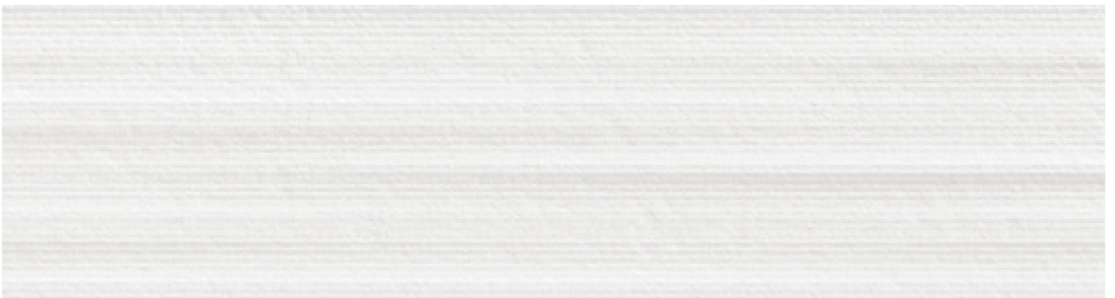
combed - mat texturé