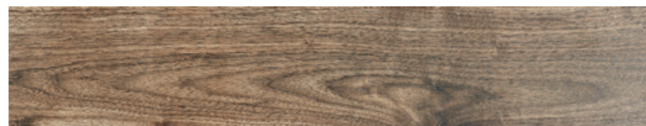
P.E. BAYARD VIEJO