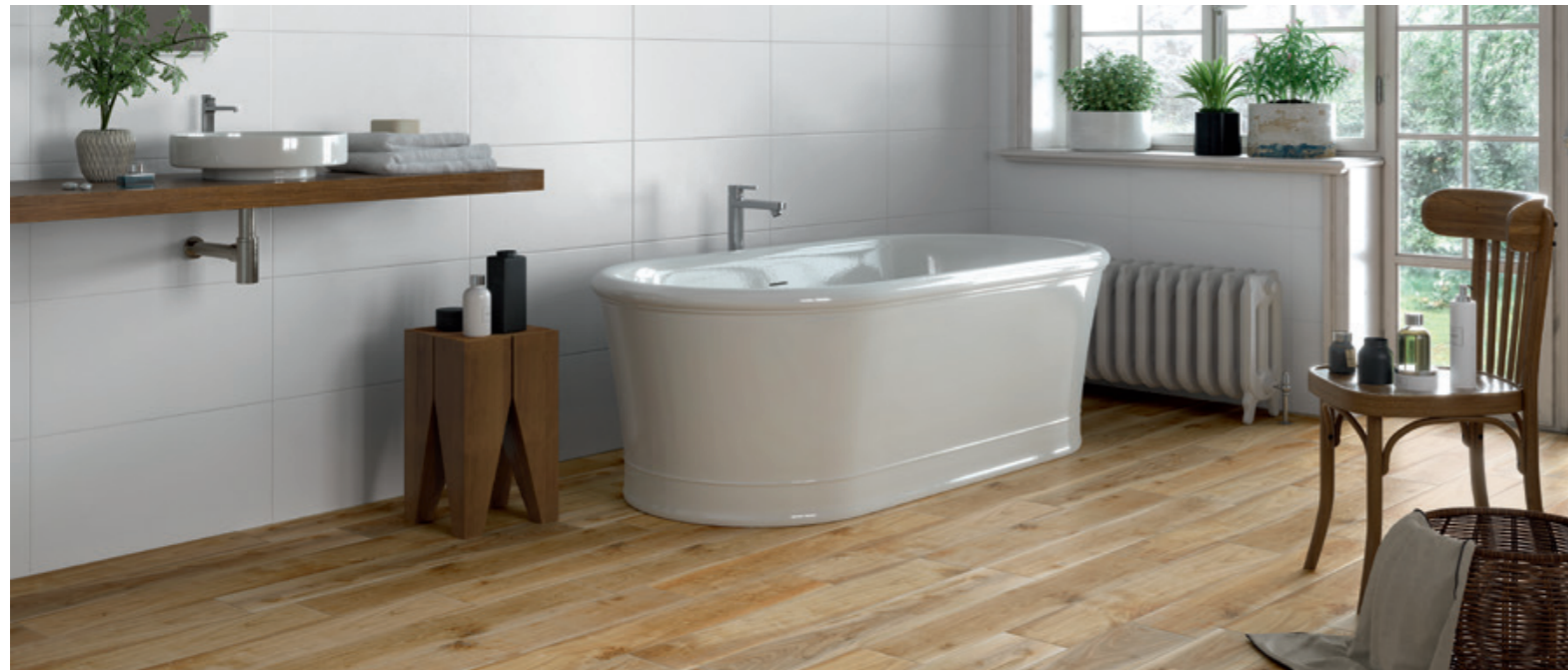
AMBIENTE PORC. ESM. BAYARD NATURAL 23x120