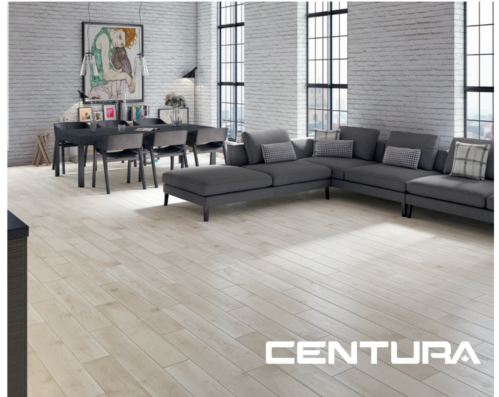
AMBIENTE PORC. ESM. BAYARD BLANCO 15x90